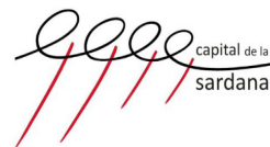
Premi a la Continuitat 2014

correu: sardanistes.and@gmail.com web: sardanistes-and.com